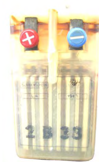
Abbildung 11: Hersteller Fa. Sonnenschein