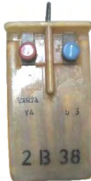
Abbildung 4: Hersteller Fa. Varta