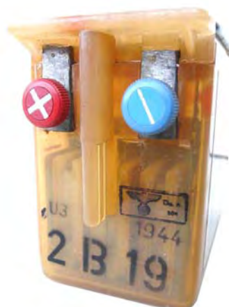
Abbildung 2: Ansicht des Sammlers 2B19

Der 2B38 war einer der häufigsten Heizakkus, wobei für andere mobile Funktechnik in ähnlichem Aufbau die Typen 2B19 u.a. produziert wurden.