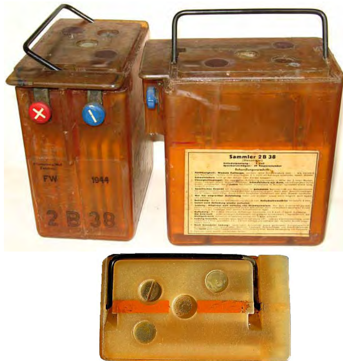
Abbildungen 1: Ansicht des Sammlers 2B38

Die Stromversorgung dieser Geräte erfolgte aus einem Zubehörtornister, in dem Anodenbatterien und Heizakkus untergebracht waren / 3/. Die 2-Volt-Heizung der Röhren machte somit die zeitgleiche Entwicklung eines geeigneten Sammlers erforderlich. Hierfür war ab 1935 bis zum Ende des Krieges der 2B38 als tragbarer und kippstärkerer Akkumulator im Einsatz.