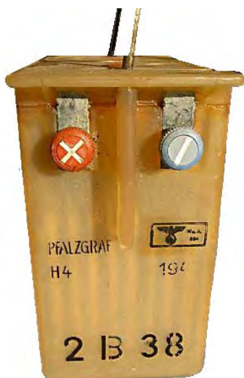
Abbildung 5: Hersteller Fa. Pfalzgraf