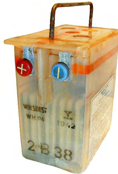
Abbildung 8: Hersteller Fa. W.H. Soest