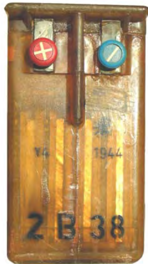
Abbildung 14: Kennzeichnung: Kurzbezeichnung Y4 Hersteller gemäß Tabelle 1: Fa. Varta