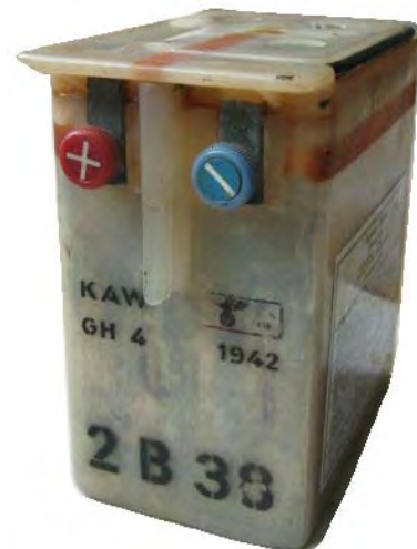
Abbildung 10: Hersteller Fa. Kölner Akkumulatorenwerke AG