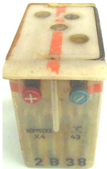
Abbildung 9: Hersteller Fa. Hoppecke