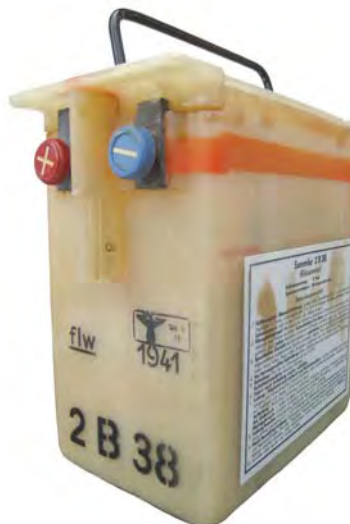
Abbildung 15 Kennzeichnung: Fertigungskennzeichen flw Hersteller gemäß Tabelle 1 / 4/ : Fa. A. Luscher

Eine weiterführende Auswertung der Fertigungskennzeichen für Waffen, Munition und Gerät vom Oktober 1944 / 4/ zeigt, dass auch andere Akkumulatoren-Fabriken für die deut-