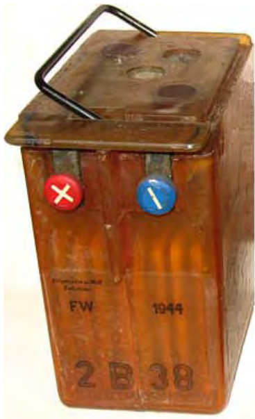
Abbildung 3: Hersteller Fa. Friemann und Wolf

Die nachfolgenden Bilder zeigen jene Firmen, für die eine Produktion von 2B38 durch den Verfasser nachweisbar ist.