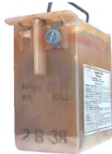
Abbildung 12: Hersteller Fa. Berga