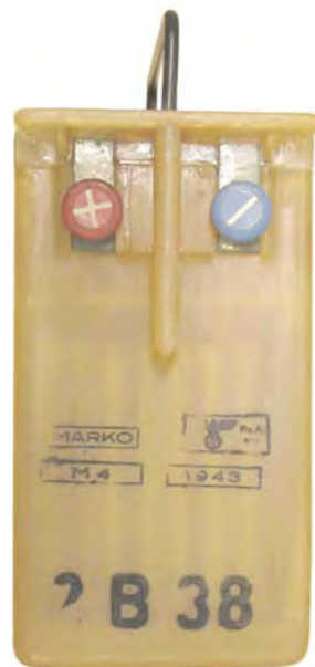
Abbildung 13: Hersteller Fa. Breslauer Akkumulatoren-Fabrik Marschel & Co. (MARKO)

Desweiteren ist bei Ebay ein 2B38-Akku angeboten worden, der als Kennzeichnung das Fertigungskennzeichen „sbe“ sowie die Jahreszahl 1944 trug. Die Herstellerfirma ist gegenwärtig nicht bekannt, da die Veröffentlichung der Fertigungskennzeichen in der Liste der Fertigungskennzeichen für Waffen, Munition und Gerät des Oberkommandos des Heeres / 4/ im Oktober 1944 mit dem Kennbuchstaben o endet. Es ist jedoch bekannt, dass weitere Buchstaben jenseits des „o“ an Firmen vergeben wurden. Um welche Firmen es sich hierbei handelt, konnte bisher nur in Ausnahmefällen geklärt werden.