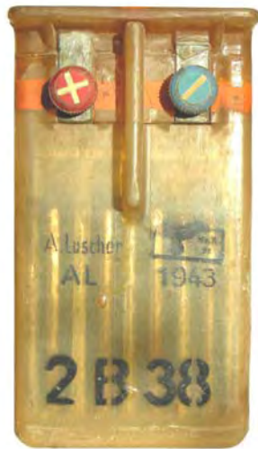
Abbildung 7: Hersteller Fa. A. Luscher