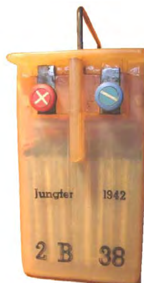
Abbildung 6: Hersteller Fa. Jungfer